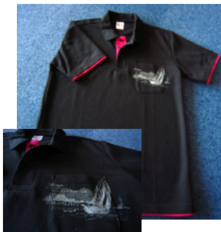
ブラック×ホットピンク