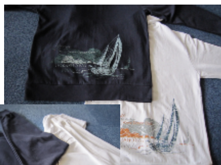
左:ネイビー 右:ホワイト

ジャージージップパーカーは、左胸に Vivre Ocean Club のロゴ、背中下部にヨットのイラストが入っています。ジッパーはダブルになっているので胸部だけ閉めたり、腹部だけ閉めたりと調整が可能です。薄手の生地ですので春、夏、秋と年間を通して着用していただけます。サイズは110cm、130cm、S、M、L、XLの6サイズです。