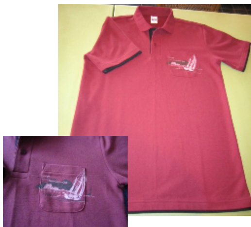
バーガンディー×ブラック